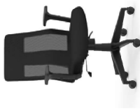
Respaldo medio. Respatiller mita / Dossier moyen / Medium backrest / Mittlere Rückenlehne.