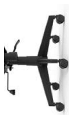
Negro de nylon Nylon / Schwarz aus Nylon.